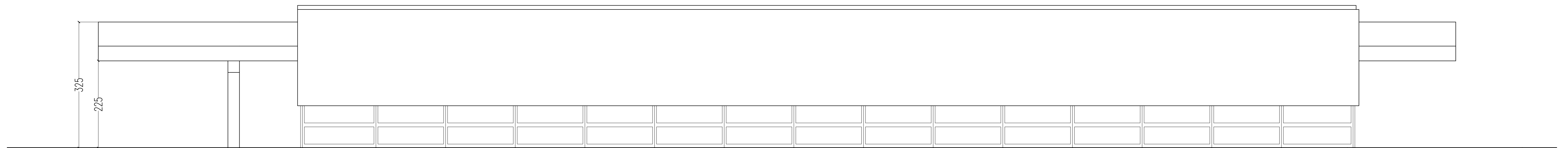
PROSPETTO SUD-OVEST sc. 1:50